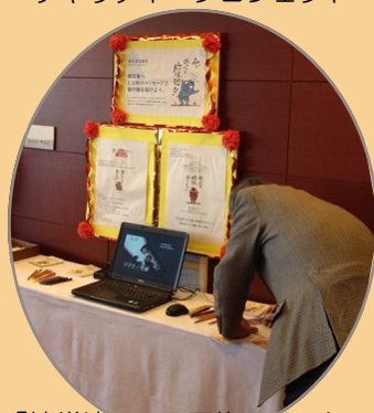
「被災地へ 一万枚のメッセージと 緑の種を届けよう」

♠これからも声を出し続けて行こうと思えました。(自分の言葉で良いのだと気付かされた思いがしています。)(60代以上男性)