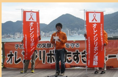
オレンジリボンたすきリレーin下関 大会宣言