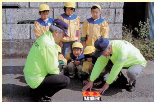
園児とともにストップマークの貼付

表彰は、各地区、県、東北で行うもののほか、全国規模で行う緑十字金（銀、銅）章の制度があります。