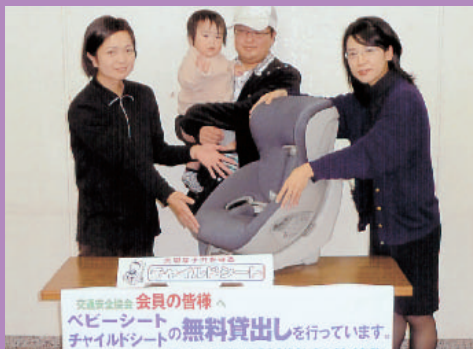
交通安全協会 会員の皆様へ ベビーシート チャイルドシートの無料貸出しを行っています。

交通事故による乳・幼児のケガなどを少なくするため、平成10年（1998年）からチャイルドシート、ベビーシートを購入し、各地区交通安全協会から、希望する会員の方に無料で貸出しを行っています。